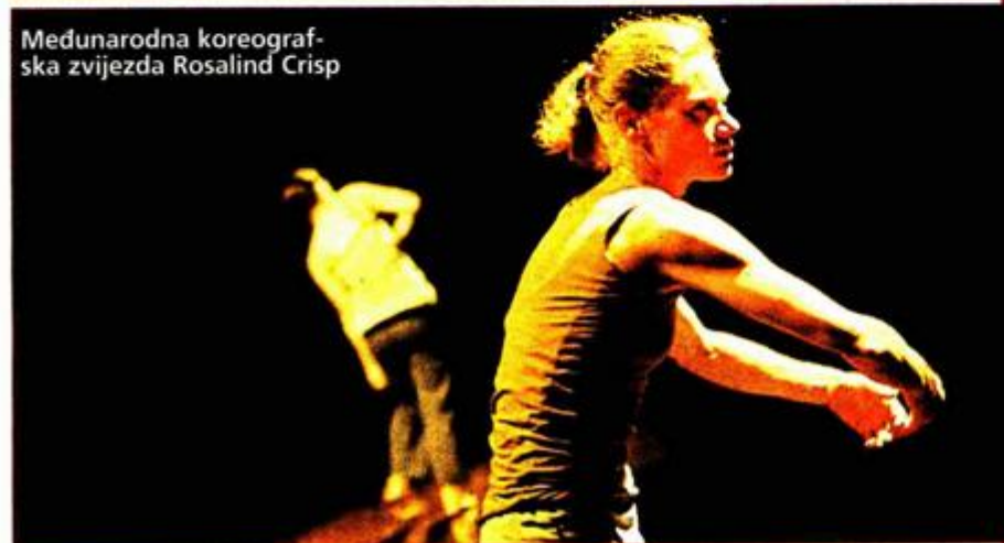
Međunarodna koreografska zvijezda Rosalind Crisp