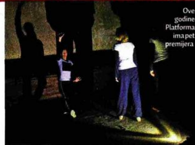
Ove godine Platforma ima pet premijera