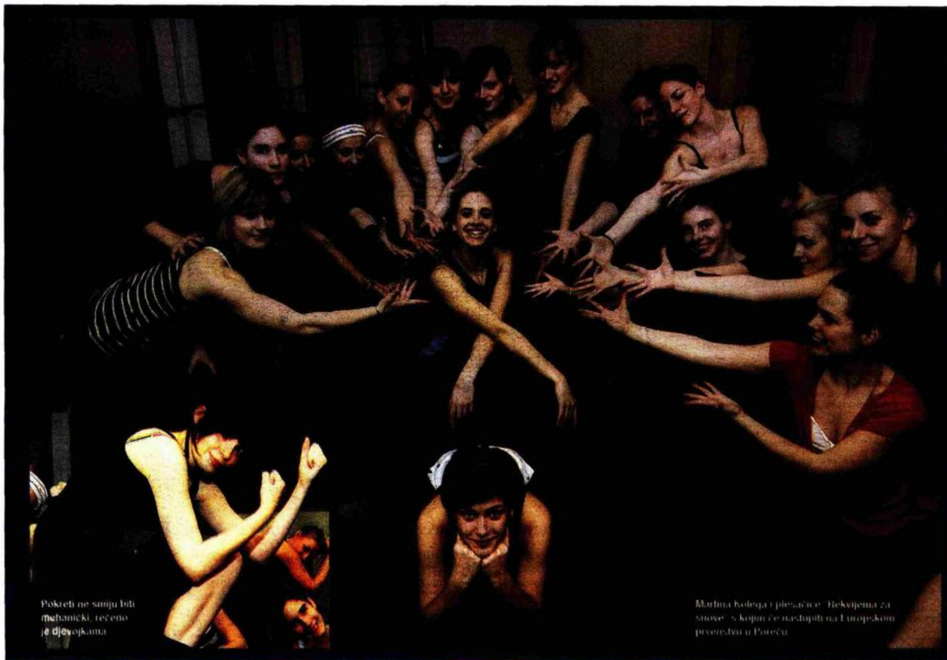
Pokreti ne smiju biti mehanički, rečeno je djevojkama