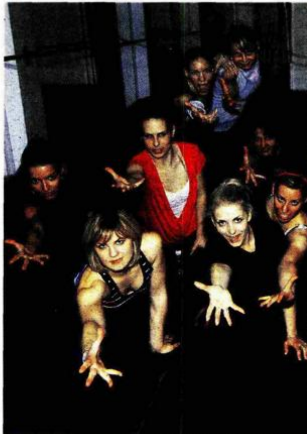
Dobro raspoloženje u "Tali" prenosi se i na gledatelje

– Možda će vam zvučati čudno, ali ja stalno u misli-